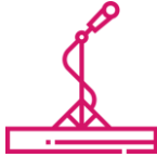
Interview auf der Bühne