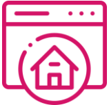
DeuKo Website Logowall