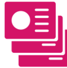
Folien in den Pausen-Loops