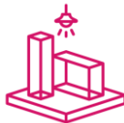
Stand im Foyer