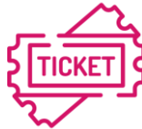
Logo auf der Eintrittskarte