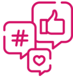
Social Media Postings